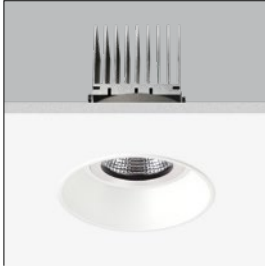
CEILING CUT Ø148