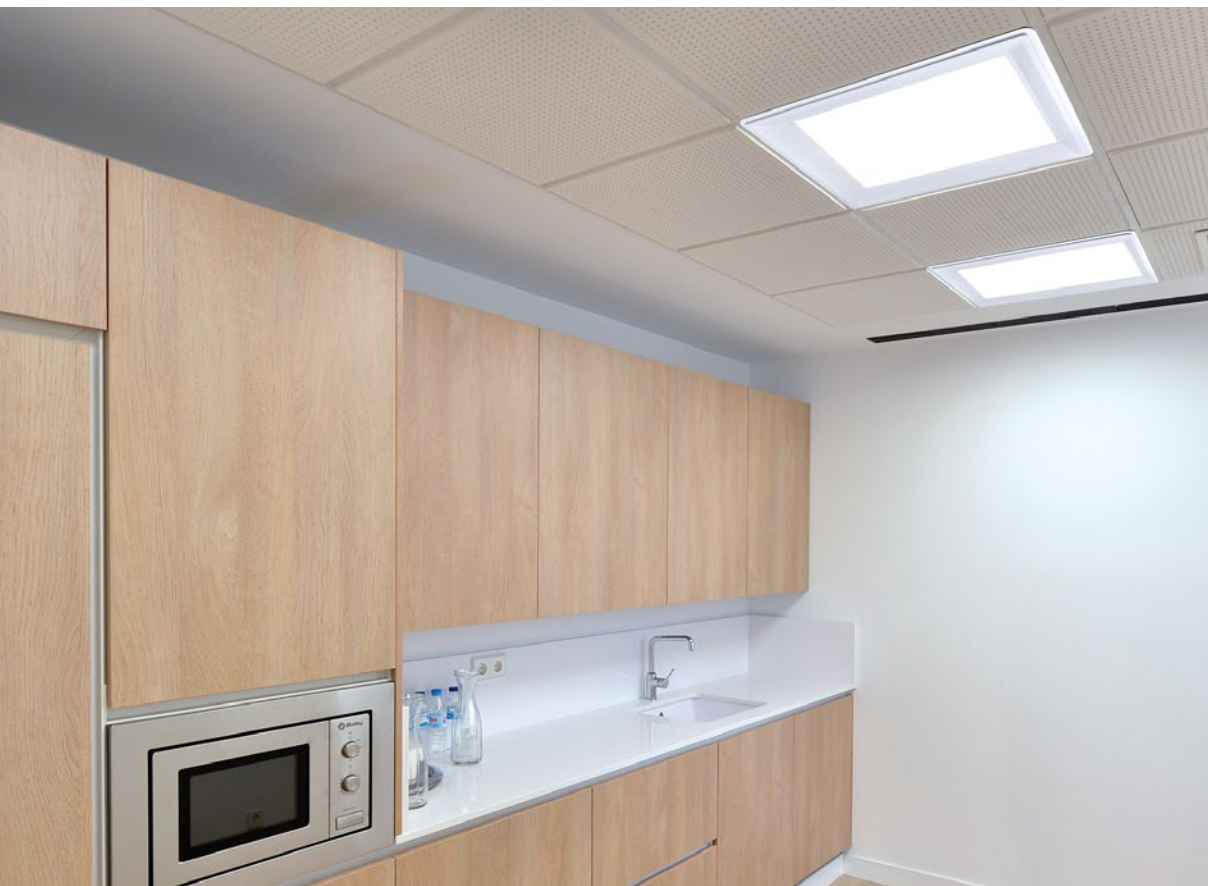
en la imagen_in the picture